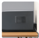
Boczne gniazdo zasilania