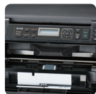
Obsługa z przodu